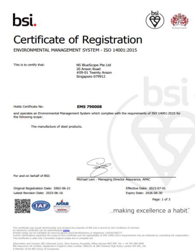
รับการรับรอง ISO14001:2015