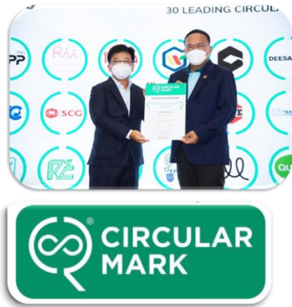
รับการรับรอง Circular product Label