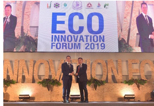
รับรางวัลความรับผิดชอบต่อสังคม CSR-DIW