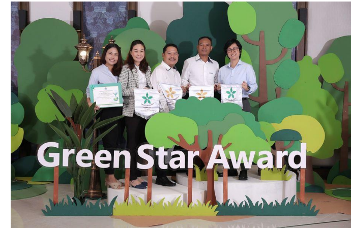
รับรางวัลธงขาวดาวเขียว-ดาวทอง