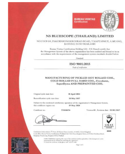
รับการรับรอง ISO9001