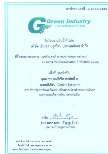
รับการรับรองการเป็นอุตสาหกรรมสีเขียวระดับ 3